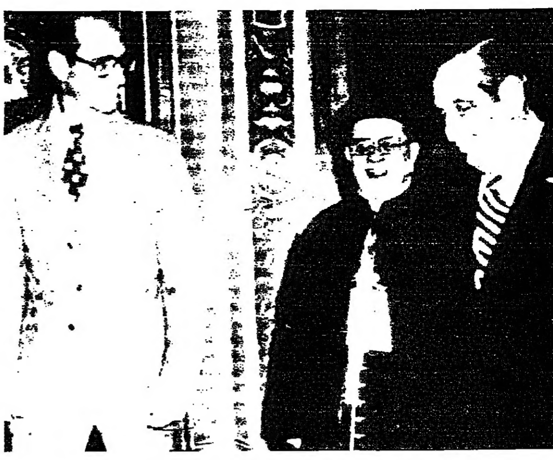
البيروت خريش بنوسف الرئيس طو وشركه في القصر البلدي في باريس (صورة بالرايو من أ.ب.)